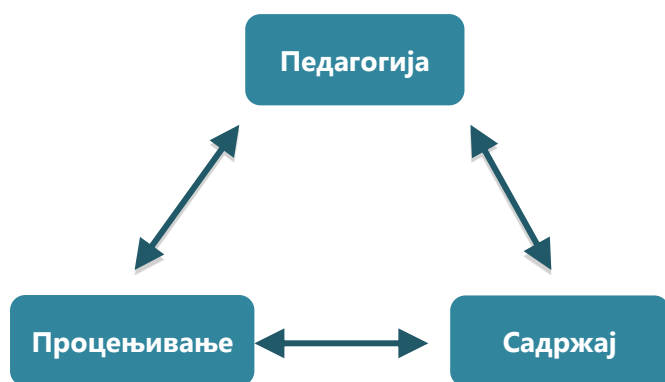
Слика 1: Интеракција између основних аспеката ђачког учења

Потребно је, ипак, више искуства и дискусије о импликацијама у непосредном раду с великим идејама на уму. Овде се намеће, само по себи, питање које промене би било неопходно унети, при раду с овим идејама, у основне елементе ђачког учења: избор садржаја курикулума, педагогији и ђачком процењивању? Зато ћемо у овом одељку покушати да дамо одговор на ово питање.